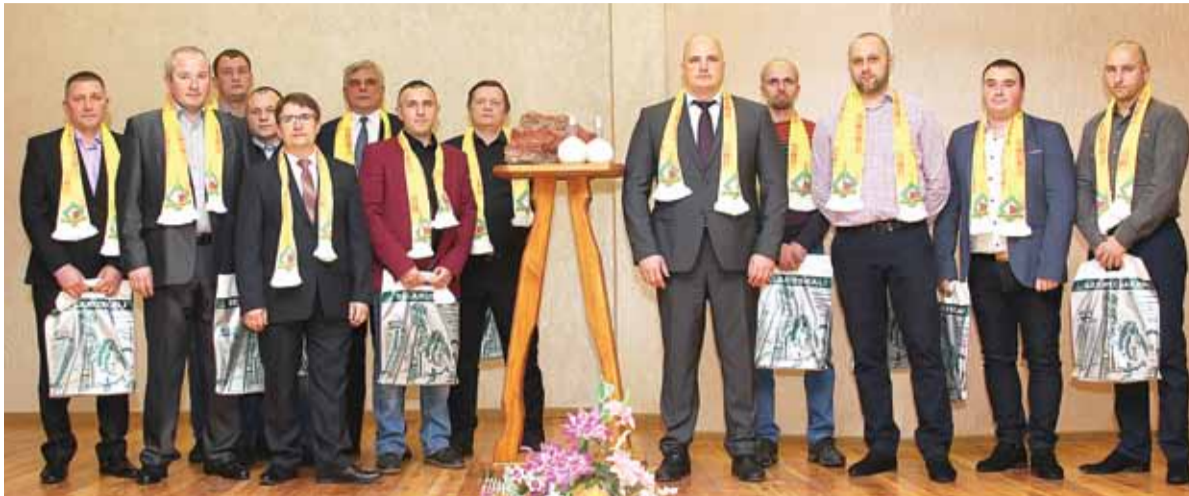
Коллектив бригады ПКС-8 №21 с руководством рудника, управления РУ-4 и Общества во время торжественного мероприятия, посвященного чествованию передовиков производства РУ-4 (январь 2018 г.).

Значимость проходческих комплексов для рудников очевидна: без качественной проходки и подготовки панелей невозможно запустить в экс-