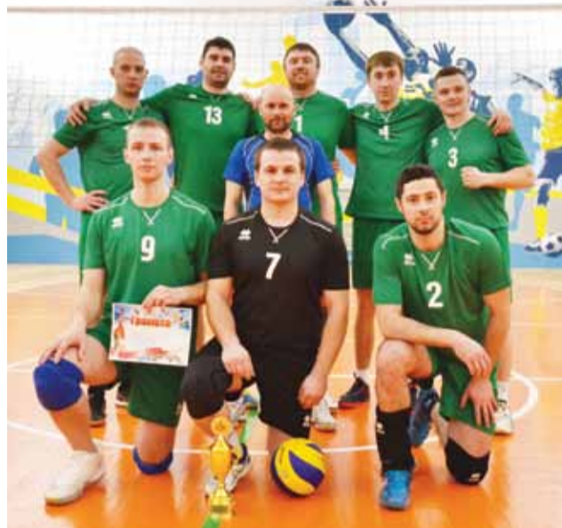
Победитель волейбольных соревнований — команда РУ-2.

2-е место завоевали спортсмены команды РУ-1. Игроки РУ-4 в упорной борьбе заняли 3-е место. Достойное сопротивление оказала соперникам команда РУ-3, но в результате — заняла 4-е место в зачете спартакиады по волейболу.