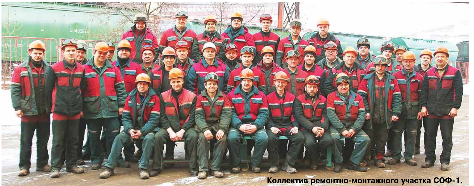
Коллектив ремонтно-монтажного участка СОФ-1.