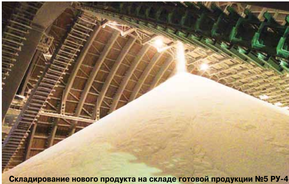
Складирование нового продукта на складе готовой продукции №5 РУ-4.