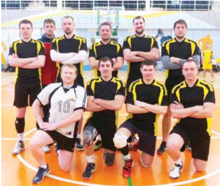
Волейболисты РУ-1 заняли 2-е место.

По итогам соревнований второй год подряд победу одерживает сплоченная команда РУ-2.